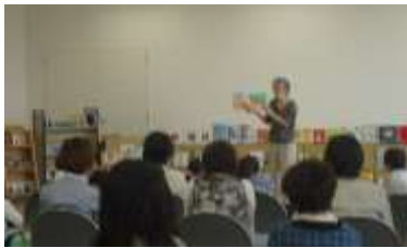
パパもじいじもえほんよんで！