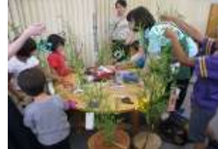
おやまのがっこう