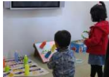
むかしあそびをしよう【わなげ】