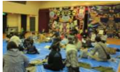
ワクワクワークショップ「かおかおさんをつくらう!」