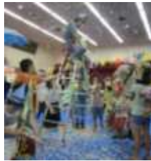
スズキョージのステきなかんむりをつくってパレードしようぜい!