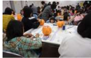
ハロウィン工作教室